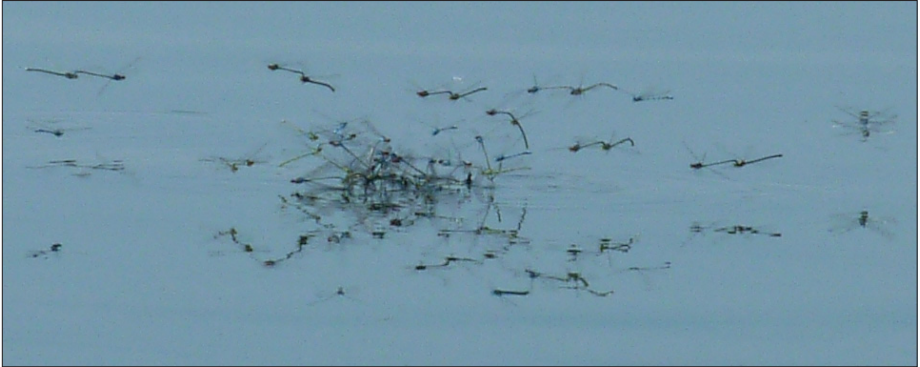
Abb. 1: Ausschnittvergrößerung einer fliegend/sitzenden Versammlung von Erythromma viridulum und Enallagma cyathigerum, 05.08.2013

net werden und sind entsprechend eingefärbt: Erythromma viridulum in schwarz, Enallagma cyathigerum in türkis. Die Spiegelbilder werden weggelassen, ebenso wie die Flügel. Die nicht näher bestimmbar, teilweise untergetauchten Akteure sind durch Randlinien gekennzeichnet. Insgesamt sind auf dem Ausschnitt 16 Tandems und 4 Männchen von Erythromma viridulum sowie 1 Tandem und 5 Männchen von Enallagma cyathigerum auszumachen. Zusammen mit etwa 11 undeterminierten Individuen ergibt dies eine Versammlung von ca. 54 Tieren. Fast alle nicht bestimmten Tiere dürften sitzen, während die übrigen mehrheitlich fliegen. In ca. 80 cm Entfernung rechts der Ansammlung sind auf dem Foto zwei weitere sitzende Tandems von Erythromma viridulum bei der Eiablage über Wasser und ein Tandem fliegend zu sehen. Das Ablagesubstrat ist nicht sichtbar. Dutzende weitere Tiere beider Arten, die auf dem Foto erkennbar sind, fliegen teilweise zu den Versammlungen oder von ihnen weg oder reagieren scheinbar nicht auf diese.