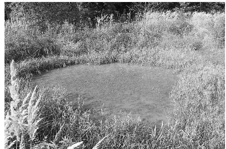
Tümpel Muckenmähd (cu)

Tümpel Neubergwiese. Kleingewässer, durch Naturschutzmaßnahme entstanden, seit Anfang der 1990er-Jahre. Sukzession deutlich abgeschwächt, wird regelmäßig am Ufer gemäht und von aufkommenden Gehölzen befreit. Immer wieder einzelne immature Tiere, langfristig wohl stabil, aber kein großer Bestand; trocknet nicht aus.