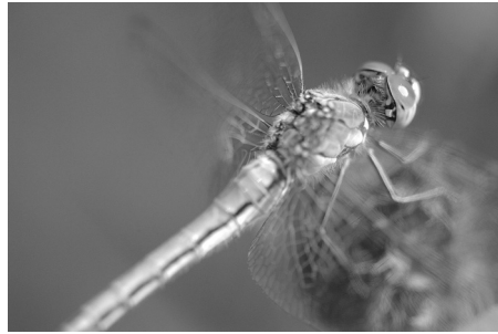
S. flaveolum Weibchen (bk)

Massenentwicklungen in Jahren mit optimaler Wasserführung hervorbringen, während Totalausfälle in Trockenjahren möglich sind. 2) Tümpel mit erheblichen Wasserstandsschwankungen, in denen die Larven pflanzenreiche Bereiche besiedeln, die im Sommer meist trocken fallen. Die verbleibenden Wasserflächen sichern den Larven zwar oft eine maximale Entwicklungsdauer, aufgrund ihrer Kleinträumigkeit aber höchstens für eine beschränkte Anzahl Individuen. 3) Verlandungsbereiche von Weihern, Teichen und Seen mit sommerlichen