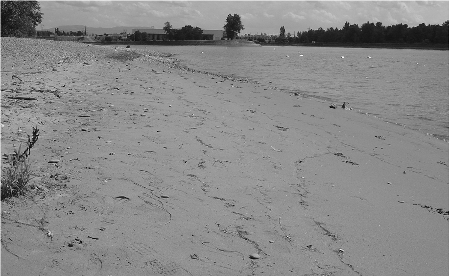
Abb. 1: Fundstelle der Exuvien von Gomphus flavipes am französischen Rheinkanal bei Vogelgrun/Breisach, mit ausge-dehntem Flachufer (Juli 2005).

Im Jahr 2005 wurde eine Flachuferzone am französischen Rheinkanal auf der Höhe von Breisach erstmals besucht. Dabei wurden mehrere Exuvien einer Gomphiden-Art im Spülsaum entdeckt. Es stellte sich heraus, dass es sich um die Asiatische