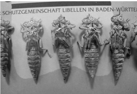
Abb. 2: Exuvien von Gomphus flavipes (Asiatische Keiljungfer) von einem Flachuferabschnitt des Rheinkanals bei Vogelgrun/Breisach.