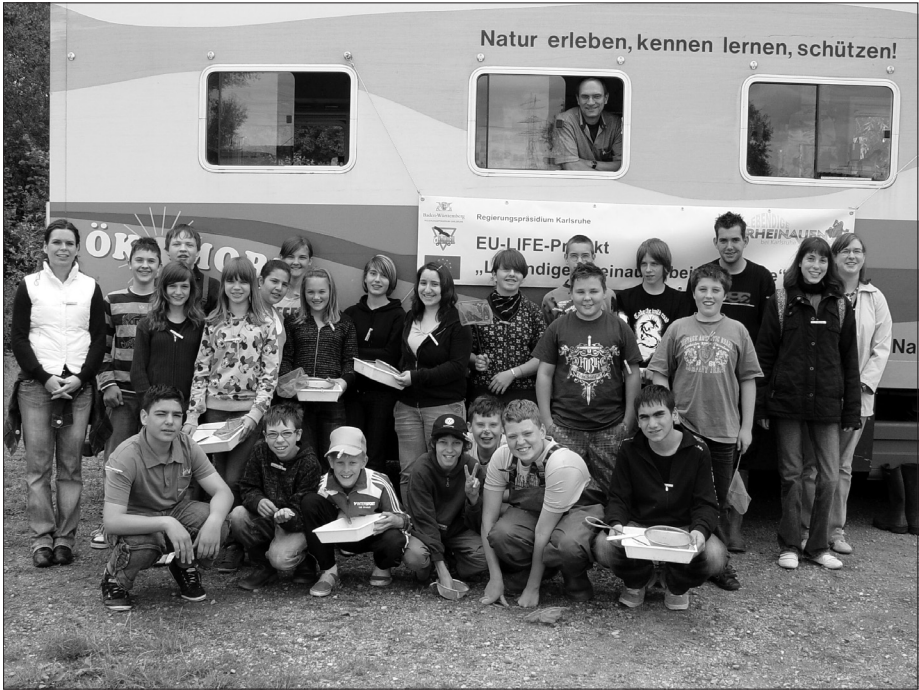
Abb. 3 Die 7. Klasse der Konrad-Adenauer-Realschule Philippsburg vor dem Ökomobil, 10.7. 2009.

Hunger als Orthetrum cancellatum bestimmt. Bei einer anschließenden öffentlichen Libellenexkursion wurden frisch geschlüpfte Exemplare von Orthetrum cancellatum am unmittelbar anschließenden Uferbereich gefunden, außerdem ein Männchen der kleinen Königslibelle ( Anax parthenope ) und weitere Arten.