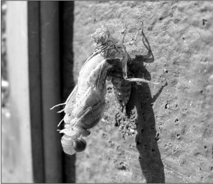
Abb. 1: Orthetrum cancellatum Larve beim Schlupf an der Wand des Anglerheims am Freyersee, 10.07.2009: 10:08 Uhr.

Eine ähnlich verblüffende Beobachtung gelang am 10. Juli 2009 Schülerinnen und Schülern einer 7. Klasse der Konrad-Adenauer-Realschule Philippsburg (Landkreis Karlsruhe). Während einer naturschutzpädagogischen Veranstaltung mit dem Ökomobil des Regierungspräsidiums Karlsruhe, die im Rahmen des EU-LIFE-Projekts „Lebendige Rheinauen bei Karlsruhe“ stattfand, entdeckten die Jugendlichen gegen zehn Uhr MESZ ein schlüpfendes Tier, das in etwa 10 cm Höhe an einer Hauswand hing. Die Oberseite der Larvenhaut war bereits aufgeplatzt und die Libelle begann, sich allmählich aus der Larvenhülle herauszuarbeiten. Um 10:35 Uhr war der