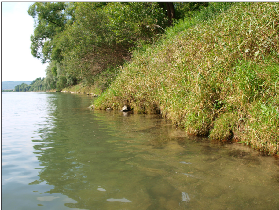
Abb. 2: Restrhein nördlich Märkt; Blick nach Norden 01.07.2010