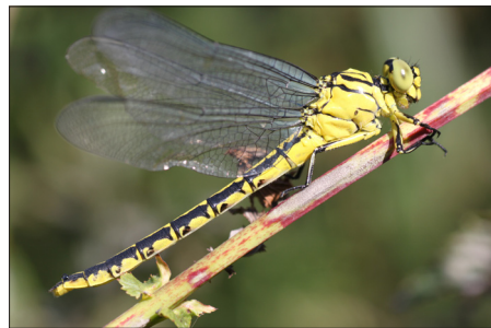
Abb. 1: Gomphus flavipes, Rheinau-Freistett 16.07.2011