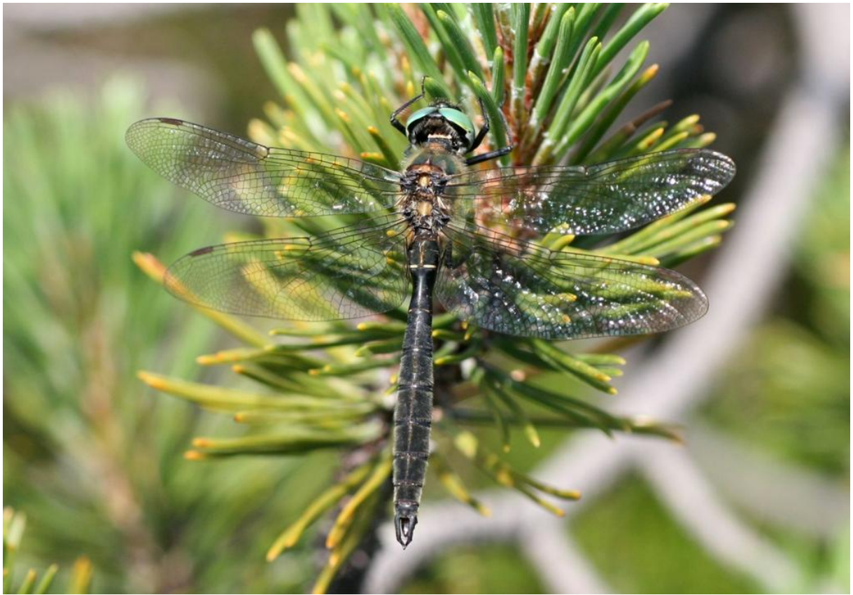
Alpen-Smaraglibelle ( Somatochlora alpestris )