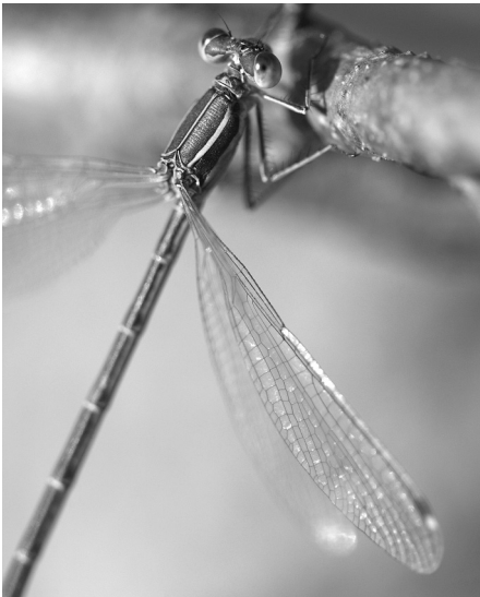
L. barbarus Weibchen (bk)

Die Südliche Binsenjungfer ( Lestes barbarus ) ist eine Pionierart, die in der Lage ist, geeignete Gewässer rasch zu besiedeln. Dies war wohl einer der Gründe, weshalb die Art auch in Baden-Württemberg lange Zeit nur als gelegentlicher Vermehrungsgast eingestuft wurde. Sie wurde in den letzten Jahren häufiger gefunden, was nicht nur auf klimatisch günstige Jahre, sondern auch auf Gewässererneuanlagen, z.B. im Rahmen des Artenschutzprogramms Libellen, und auf gezielte Bestandsüberprüfungen zurückgeführt wird (SCHIEL & KUNZ