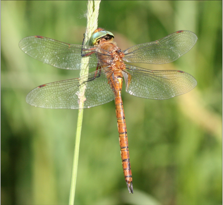
Abb. 1: Ruhendes Männchen von Aeshna isoceles aus der Rheinebene. 25.05.2009